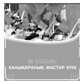
12 ТАМЫЗ - ХАЛЫҚАРАЛЫҚ ЖАСТАР КҮНІ

Егемен елдің жастары баянды болашақтың бай рағын көтеріп, жарқын келешектің желкенін керіп келеді. «Мен жастарға сенемін!» деп үкілі үміт, салқар сенім артқан Мағжанның жауһар жырына арқау болған ел ертеңі жастар қашанда елдің ертеңі үшін аянбақ емес.