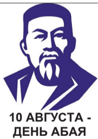
10 АВГУСТА - ДЕНЬ АБАЯ

Абаем создано около 170 стихотворений и 56 переводов, написаны поэмы, прозаическая поэма «Қара сөз» – «Слова назидания» («Қара сөздер»), состоящая из 45 кратких притч или философских трактатов. В этих «Назиданиях» поднимаются проблемы истории, педагогики, морали и права этнических казахов. Он также был композитором, создал около двух десятков мелодий, которые популярны и в наши дни.