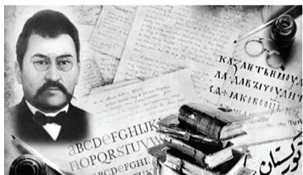
Ахмет Байтұрсынұлының 150 жылдығы

Чтобы сделать жизнь счастливой, нужно любить повседневные мелочи. Это и сияние облаков, и дуновение ветра, и солнечные лучики, и шелест листьев, чирикание воробьиной стаи, лица прохожих. Во всех этих мелочах нужно находить свое наслаждение. Не обращая на все это внимания, мы порой не замечаем красоту природы вокруг нас. А ведь иногда нужно просто остановиться и посмотреть вокруг!