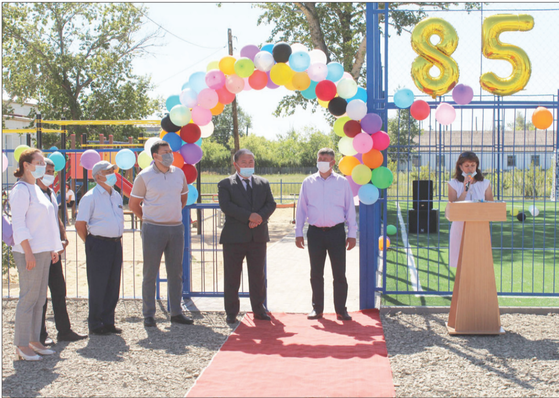
(Продолжение на 5 стр.)

В рамках 30-летия Независимости страны в селе Каменка Астраханского района состоялась открытие многофункциональной детской спортивной и игровой площадки. Открытие объекта приурочено также к 85-летию села. Современная многофункциональная детская площадка возведена за счет средств ТОО «Байду-Агро».