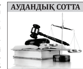
Астрахан аудандық соты.

Қаралған әкімшілік істер бойынша 164 тұлға әкімшілік жауапкершілікке тартылып, 15 тұлғаға қатысты жәбірленушімен татуласуына байланысты және басқада негіздер бойынша іс жүргізу тоқтатылды.